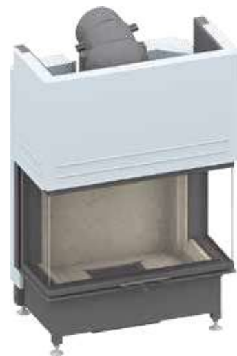
Ekko U 84(34) kanssa Hissiluukku