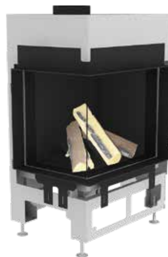
Ekko G L 67 mit Innenauskleidung Stahlblech anthrazit (matt)