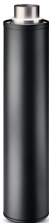
Matta tumma harmaa