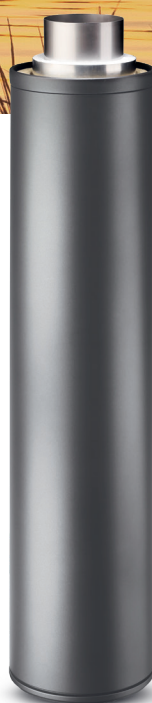
Matta vaalea harmaa